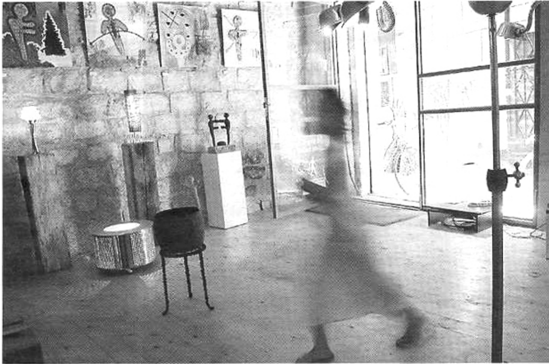
Una imatge de l'exposició Nadals reciclats, una altra mena de mercat.