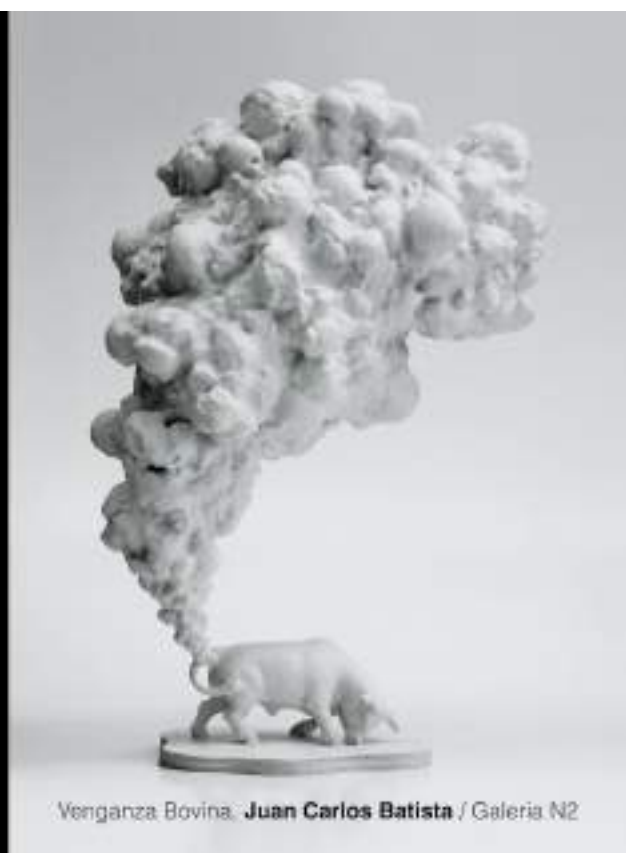
Venganza Bovina. Juan Carlos Batista / Galeria N2