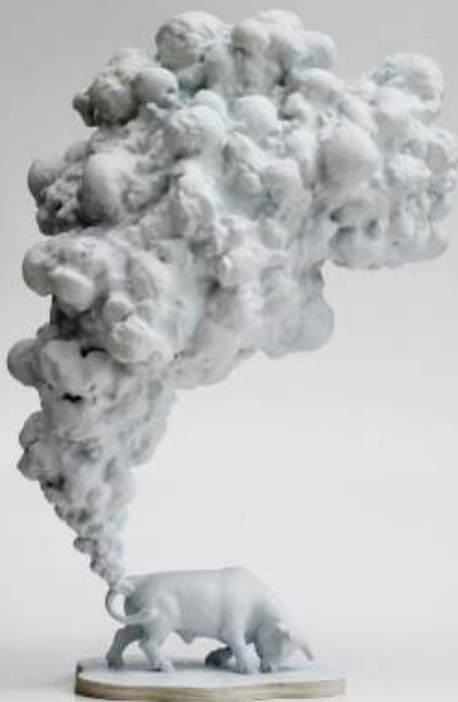
Venganza Bovina, Juan Carlos Batista / Galeria N2